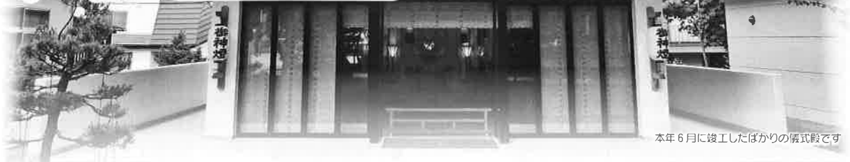
本年6月に竣工したばかりの儀式殿です